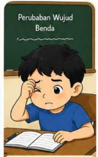
Mata Beni terasa lelah dan sulit melihat tulisan di papan tulis.