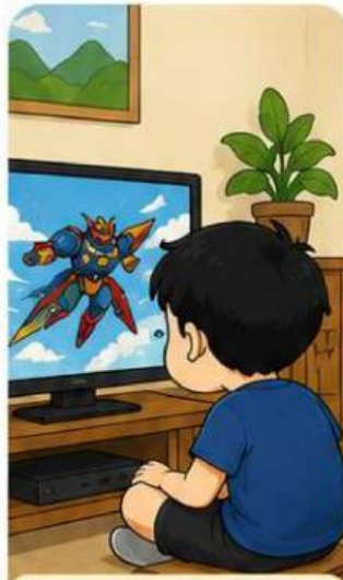
Beni menonton televisi terlalu dekat.

Keesokan harinya, mata Beni terasa lelah dan sulit melihat tulisan di papan tulis.