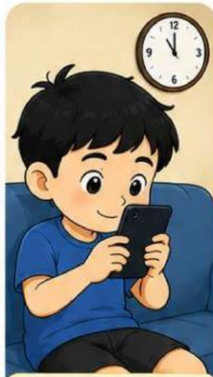
Beni bermain gawai terlalu lama.