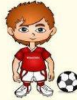
Bo - la

Kata disambung menjadi: Bola -> Lana -> Nasi