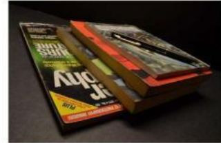
Ayo semangat menulis dengan rapi!

Petunjuk: Susunlah kata-kata di bawah ini menjadi kalimat yang benar!