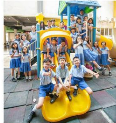
Anak-anak bermain di sekolah

Kalimat: Saya suka makan apel merah yang manis.