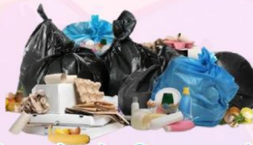
Limbah Sampah Plastik