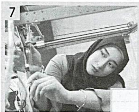
在我国的电子厂工作