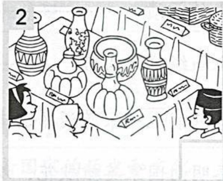
向外国游客推广我国的手工艺品