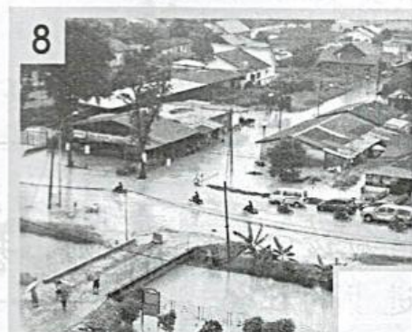
帮忙派送物资给灾民