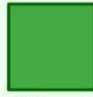
Vuông xanh ✓