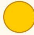
Tròn vàng ✓