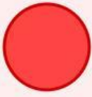
Tròn đỏ ✓