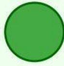
Tròn xanh ✓