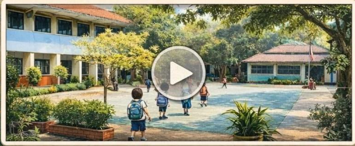
Video direkam langsung di lingkungan sekolah.