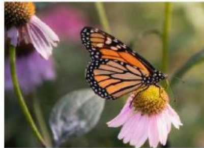
Gambar B: Kupu-Kupu