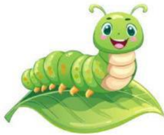
Gambar A: ulat