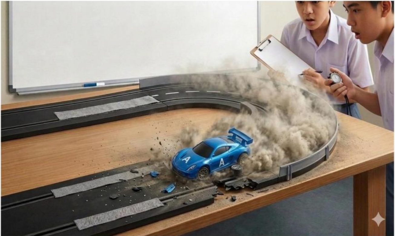
Gambar 1 Tragedi Kecelakaan Mobil Balap

Perhatikan Gambar 1 yang ditampilkan oleh Guru dibawah ini !