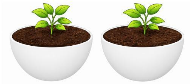
Gambar bola dibelah menjadi dua pot

Di lingkungan sekolah terdapat sebuah bola bekas yang sudah tidak terpakai. Bola tersebut dibelah menjadi dua bagian sama besar dan dimanfaatkan sebagai dua pot tanaman kecil. Setiap pot akan diisi penuh dengan tanah kompos. Bagian luar masing-masing pot (tanpa tutup) akan dicat agar terlihat lebih menarik. Bola memiliki jari-jari 7 cm. Tanah kompos dijual dalam kemasan 500 cm 3 per bungkus, sedangkan satu kaleng cat dapat digunakan untuk mengecat 500 cm 2 permukaan.