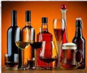
Minuman Keras ( khamr )