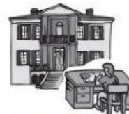
in der Schule.