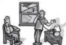
bei einem Freund.