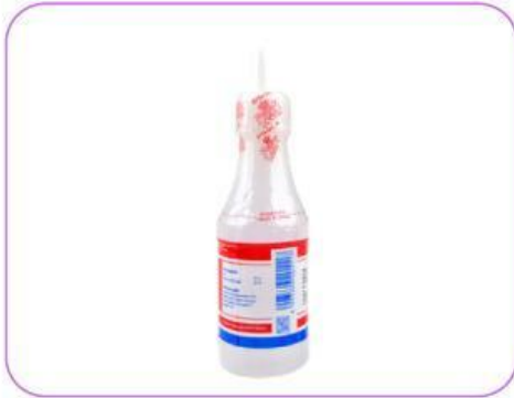
Gambar 1. Asam Cuka