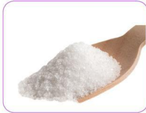
Gambar 2. Gula (Glukosa)