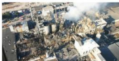
Gambar 2. Kerusakan Pabrik Imperial Sugar Pasca-Ledakan Debu Gula

Pada tanggal 7 Februari 2008, sekitar pukul 19.15, debu gula bertemu dengan sumber penyulutan hingga kemungkinan besar bantalan pengumpan sabuk yang terlalu panas yang menyebabkan ledakan. Ledakan tersebut merobek penutup terowongan. Debu yang menumpuk dan mengendap (foto arsip konveyor sebelum penutupnya (atas) dan pelat baja yang membentuk penutup terowongan, robek akibat kekuatan ledakan, ditandai dengan panah). Gula terangkat dan terbakar oleh bola api yang semakin cepat. Awan debu yang dihasilkan menyediakan bahan bakar untuk reaksi berantai ledakan sekunder yang menyebar ke seluruh bangunan. Langit-langit beton runtuh, melepaskan sejumlah besar gula dan debu gula langsung ke dalam api, secara dramatis meningkatkan kekuatan ledakan.