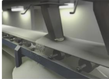
Gambar 1. Penumpukan debu gula halus di area pabrik

Pada tanggal 2 Februari 2008, sebuah pabrik gula tiba-tiba meledak dan menewaskan puluhan orang pekerjanya. Kejadian di pabrik Imperial Sugar Company itu menjadi fokus dunia internasional. Hal ini karena para ahli percaya bahwa yang memicu dan menyebabkan ledakan itu adalah akumulasi dari debu gula.