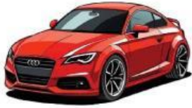
xe ô tô