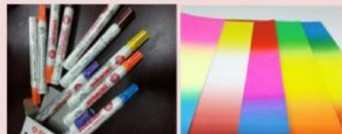
Gambar 1.1 Spidol warna dan Kertas asturo

Jika Rani ingin membeli kertas asturo dan spidol warna di toko yang sama, berapakah harga satu kertas asturo dan satu spidol warna?