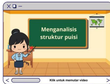
Penjelasan struktur fisik dan batin puisi "Tanean Lanjang"

Dengarkan penjelasannya satu per satu, supaya kalian bisa tahu bagian-bagian penting dalam puisi. 🎧