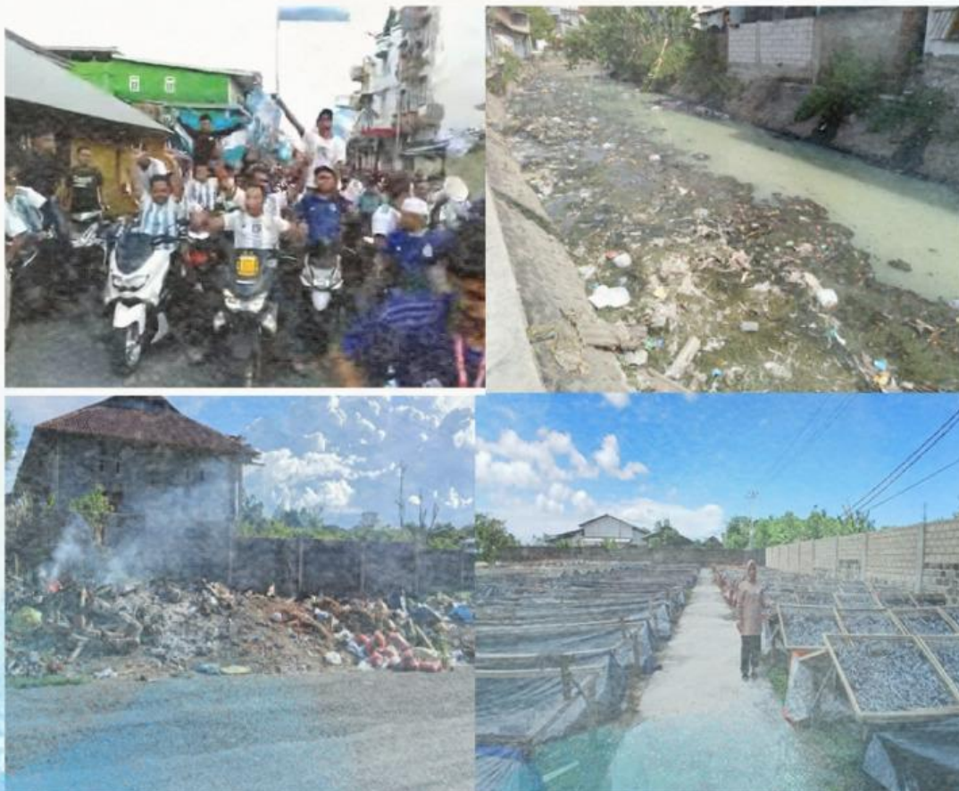
Contoh sumber pencemaran lingkungan di Kota Tual

Berdasarkan objek yang mengalami pencemaran terdiri atas pencemaran S uara, A ir, T anah dan U dara atau disingkat SATU .