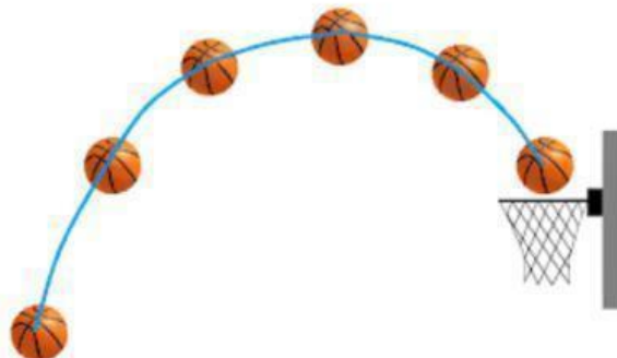
Gambar 14. Lemparan Bebas Bola Basket ke dalam Ring

Rizky sedang melakukan latihan lemparan bebas ( free throw ). Agar bola dapat masuk ke dalam ring dengan sempurna, bola harus dilemparkan dengan lintasan parabola yang melambung tinggi.