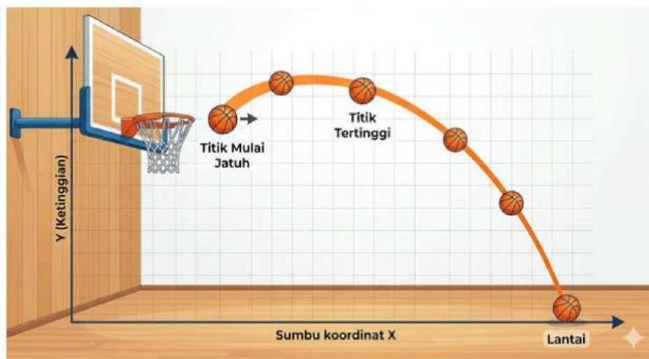
Gambar 16. Pantulan Bola dari Ring ke Lantai

Pernahkah kamu melihat bola basket yang sudah hampir masuk, tapi malah mengenai besi ring bagian dalam? Bola tersebut tidak langsung jatuh lurus ke bawah. Karena mengenai besi, bola akan memantul sedikit ke atas dan terdorong ke depan, baru kemudian terjatuh menuju lantai. Lintasan "melayang" ini membentuk sebuah bukit kecil atau parabola yang menghadap ke bawah.