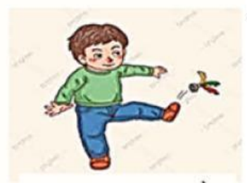
H8. Ban nam đá cầu