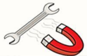
H4. Đưa nam châm lại gần thanh sắt