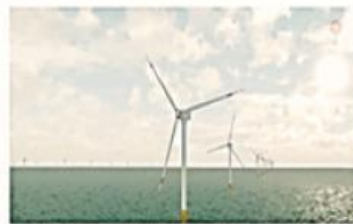
H3. Cánh quạt tua bin gió đang quay