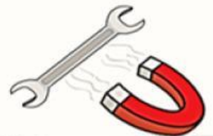
H4. Đưa nam châm lại gần thanh sắt