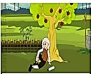
H5. Quả táo rơi