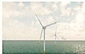
H3. Cánh quạt tua bin gió đang quay