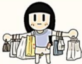
H2. Ban nữ đang xách đồ