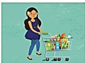
H6. Cô gái đẩy xe hàng