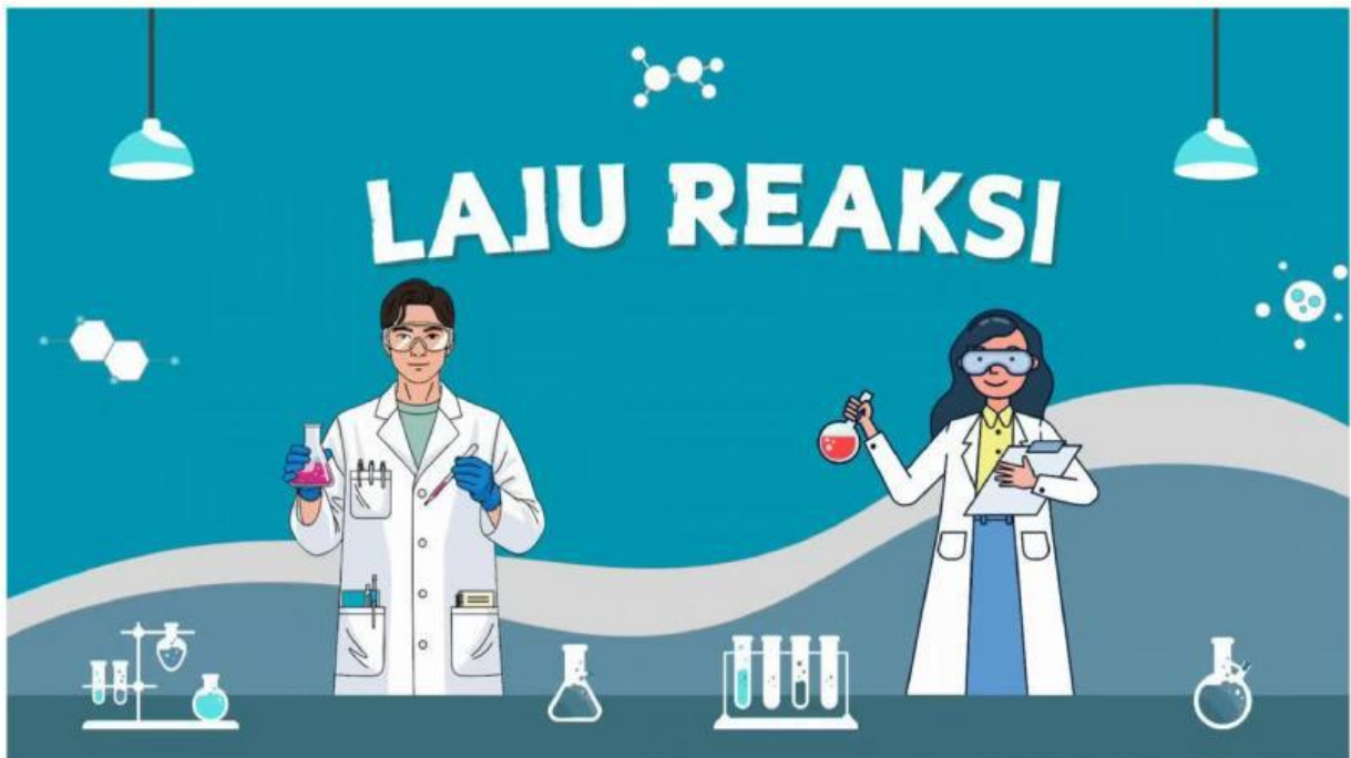
Video Materi Laju Reaksi

Silakan perhatikan dan simak dengan saksama video pembelajaran mengenai laju reaksi yang akan ditayangkan, agar kalian dapat memahami konsep, faktor-faktor yang memengaruhi laju reaksi, serta keterkaitannya dengan peristiwa kimia dalam kehidupan sehari-hari.