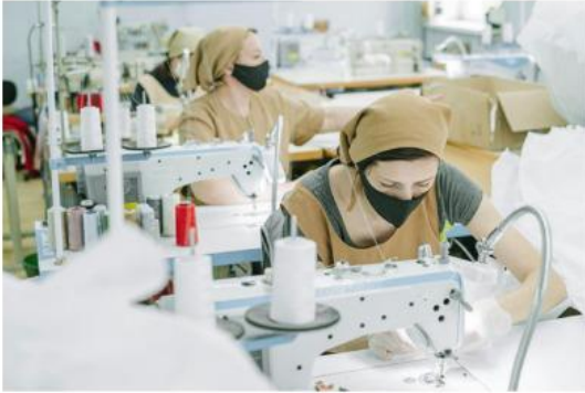
Gambar. lokasi industri biasanya terletak di dataran rendah

Apakah tempat tinggalmu berada di lingkungan dataran rendah? Perhatikan kondisi di sekitarmu. Jenis pekerjaan apa saja yang ada di sana? Dataran rendah biasanya memiliki tanah yang subur dan suhu normal sehingga masyarakat memanfaatkan lahan untuk pertanian, perkebunan, peternakan, perindustrian, pengrajin, dan pedagang