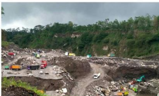
Gambar. Penambang Pasir di pegunungan

Wilayah pegunungan kaya akan sumber daya alam seperti pasir, belerang, dan batu. Hal tersebut menjadikan masyarakat yang tinggal di wilayah sekitarnya mayoritas bekerja sebagai penambang. Selain itu, wilayah pegunungan juga bisa dimanfaatkan untuk membuka lahan perkebunan teh. Jadi, masyarakat yang tinggal di pegunungan wilayah bekerja sebagai penambang dan pekebun.