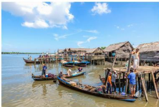
Gambar. masyarakat sekitar pantai umumnya berprofesi sebagai nelayan

Masyarakat yang tinggal di sekitar pantai dapat memanfaatkan sumber daya alam dari laut. Mereka umumnya bekerja sebagai nelayan, petani tambak ikan, petani garam, dan pengrajin. Selain itu, pantai juga dapat dimanfaatkan untuk lokasi pariwisata, sehingga banyak masyarakat sekitar yang bekerja di bidang pariwisata