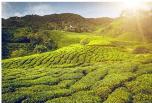
Gambar. Perkebunan teh didataran Tinggi

Apakah tempat tinggalmu berada di dataran tinggi? Perhatikan jenis pekerjaan yang ada di sekitarmu. Dataran ini memiliki ketinggian lebih dari 600 mdpl. Hal ini menyebabkan udara di sekitar menjadi dingin dan sejuk.