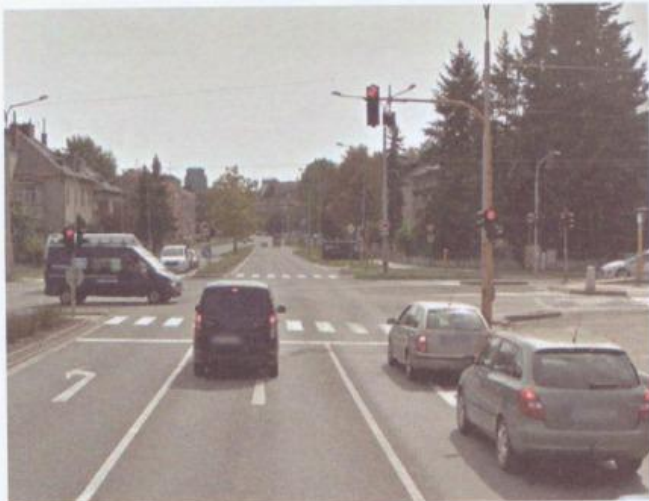
skutečnost – fotografie