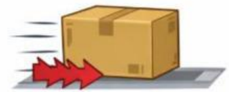
Fuerza por Fricción