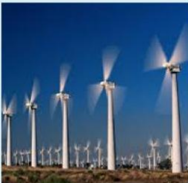
Gambar 2. PLTB