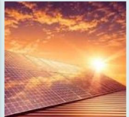
Gambar 1. PLTS

Matahari merupakan sumber energi alternatif yang memancarkan cahaya sebagai salah satu bentuk energi. Energi cahaya ini dapat dikonversi menjadi energi listrik melalui panel surya atau modul fotovoltaik (PV). Energi surya memiliki beberapa keunggulan sebagai pembangkit listrik alternatif. Pertama, ketersediaannya tidak terbatas. Kedua, beroperasi tanpa menghasilkan emisi karbon. Ketiga, matahari diproyeksikan sebagai sumber energi bersih masa depan. Indonesia sangat berpotensi memanfaatkan energi surya karena memiliki iklim tropis dengan intensitas sinar matahari yang tinggi sepanjang tahun. Hal ini menjadikan energi surya sebagai alternatif yang sangat relevan untuk diterapkan di Indonesia.