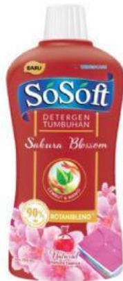
Gambar 1. Deterjen cair