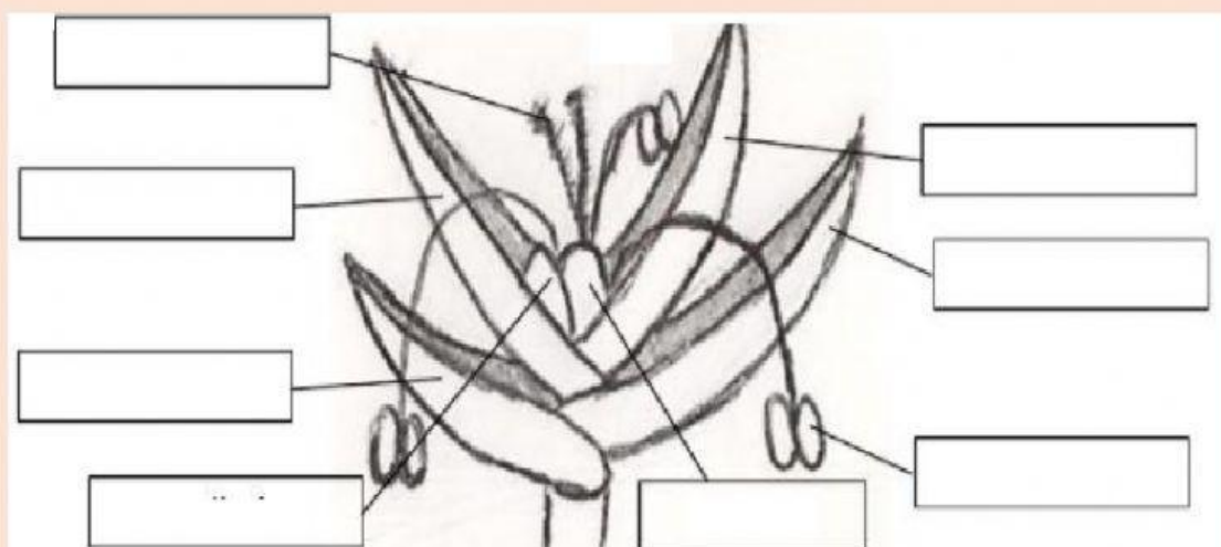
Figura 83: Inflorescência do tipo espiguetas. Esquema: André Fernandes.

LEMA GLUMA INFERIOR ESTIGMA ESTAME OVÁRIO PÁLEA GLUMA SUPERIOR LODÍCULA