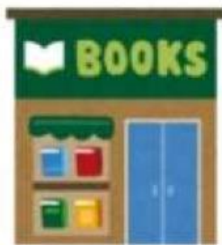
Toko Alat Tulis

Amati gambar denah di bawah ini dan jawab pertanyaan dengan tepat!