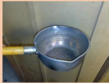
Sebelum di panaskan