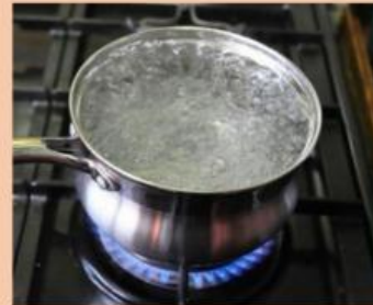
Setelah di panaskan