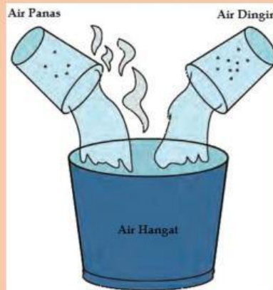
Gambar 1. Campuran air panas dan dingin