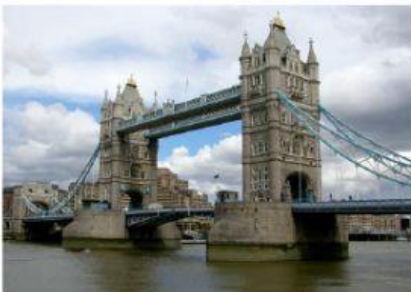
CATTEDRALE DI WESTMINSTER