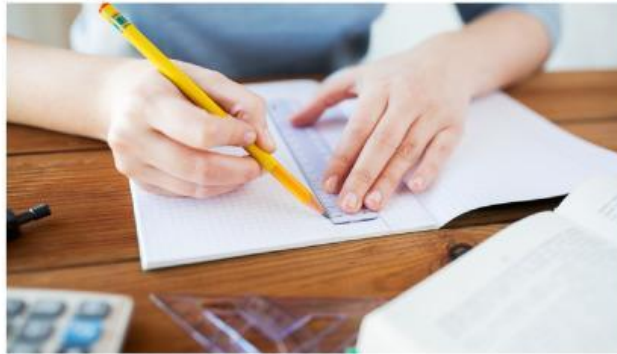
Gambar 3. Siswa Mengukur dengan mistar

Angka penting adalah semua angka yang diperoleh dari hasil pengukuran dan memiliki makna dalam menunjukkan ketelitian suatu data. Angka penting terdiri dari angka pasti dan satu angka taksiran. Misalnya, jika hasil pengukuran panjang suatu benda adalah 18,7 cm, maka angka 18 merupakan angka pasti, sedangkan angka 0,7 merupakan angka taksiran yang menunjukkan tingkat ketelitian alat ukur.