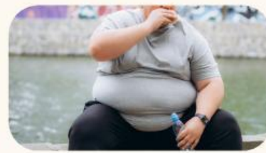
Gambar 1. Makanan cepat saji dan postur tubuh obesitas