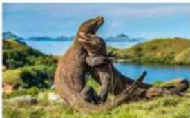
Taman Nasional Komodo