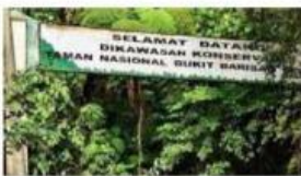
Taman Nasional Bukit Barisan