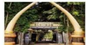
Situs Manusia Purba sangiran