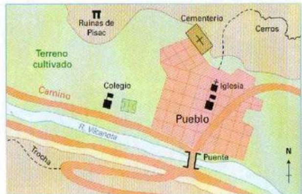
Pueblo de Pisac, un poblado nuclear (Cusco).

c. Hábitat nuclear o concentrado. Las casas y construcciones están juntas en un grupo compacto . Los pueblos nucleares tienen varias formas, desde las informales y circulares hasta otras más comunes, como la cuadrícula o damero.