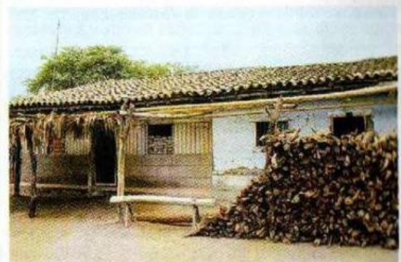
Las "rancherías" de las antiguas haciendas continúan siendo la vivienda típica de muchos pobladores costeños del área rural.

Durante mucho tiempo, las haciendas coloniales constituyeron los núcleos de asentamiento poblacional dominante en la costa. Sin embargo, con la reforma agraria de fines de la década de 1960, muchas de estas residencias fueron expropiadas conjuntamente con las tierras de cultivo y transferidas a las cooperativas agrarias. A fines del siglo XX se privatizaron muchas de esas cooperativas, con lo cual el núcleo de asentamiento se vio nuevamente alterado.