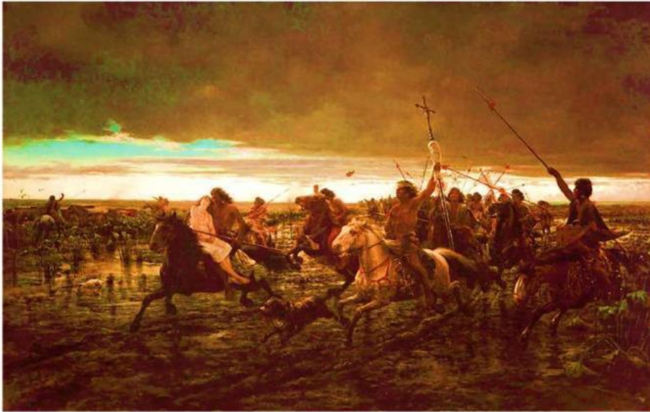
Valle, della Á. (1892). La vuelta del malón.

a. ¿Qué consecuencias de la conquista se desprenden de esta fuente?