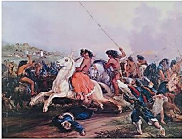
← Gay, C. (1854). Atlas de la historia física y política de Chile. Lámina "Un malón".

Respecto al acto representado en la imagen, se puede afirmar que: