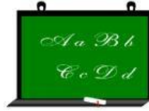
un tableau (noir / blanc)