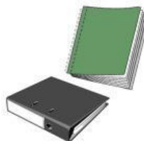
un classeur / un cahier