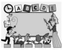
une salle de classe