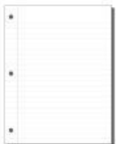
une feuille de papier