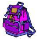
un sac à dos