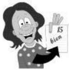
un examen un contrôle