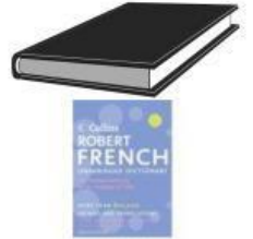
un livre un dictionnaire