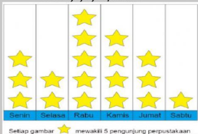
Data Pengunjung Perpustakaan

15. Jumlah pengunjung pada hari Kamis adalah sebanyak . . . .