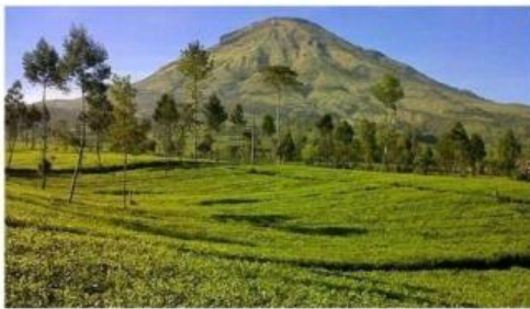
Kebun Teh Tambi Kertek

Di Wonosobo banyak sekali tempat atau destinasi yang dapat kita tuju, beri tanda centang pada 3 tempat yang ingin kamu kunjungi!