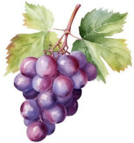
Grapes (Trái nho)