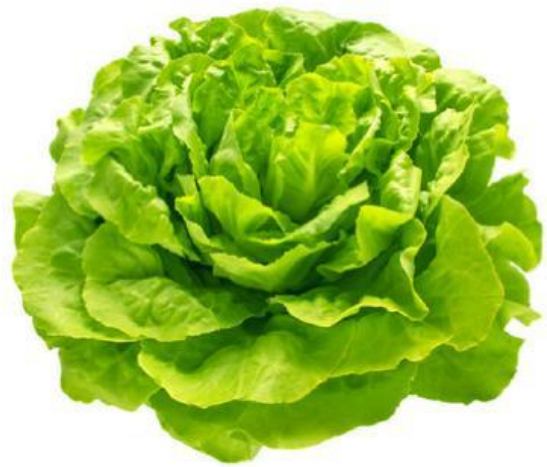
Lettuce (Xà lách)