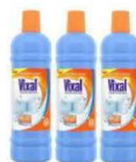
Gambar 2. Pembersih lantai