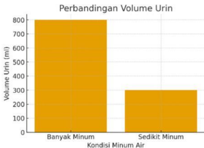
Gambar 28. Perbandingan volume urin