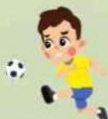
Bola yang ditendang

Energi kinetik yaitu energi yang disebabkan oleh suatu benda yang bergerak. Contohnya :