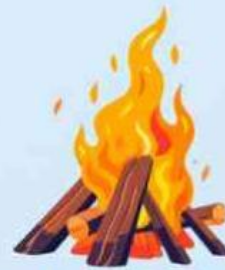
Bahan bakar seperti kayu

Energi potensial, yaitu energi yang tersimpan pada suatu benda. Contohnya :