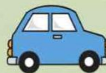
Mobil yang berjalan