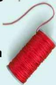
Benang 15-20 cm