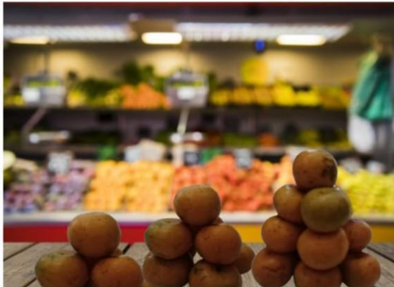
Tumpukan 1 3 Jeruk