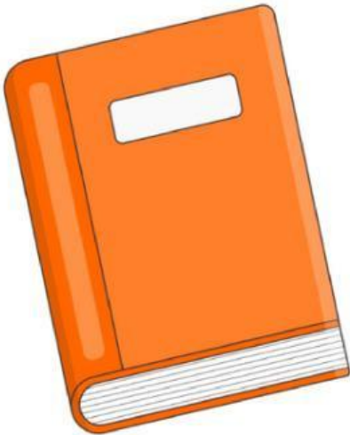
Book (Cuốn sách)