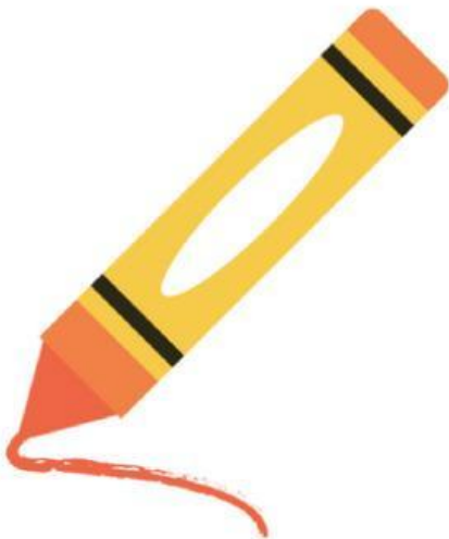
Crayon (Bút màu)