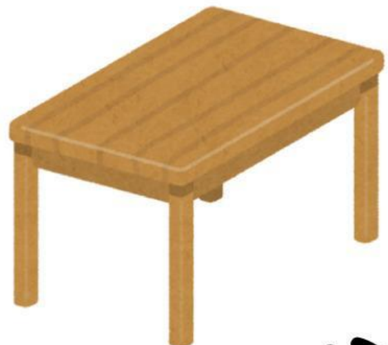
Table (Cái bàn)