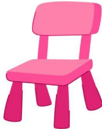
Chair (Cái ghế)