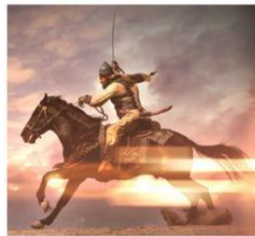
D. Dikejar oleh Suraqah