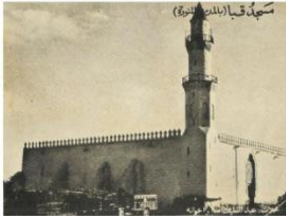
A. Membangun Masjid Quba

susunlah gambar berikut sesuai dengan urutan peristiwa hijrah Nabi Muhammad ke Madinah