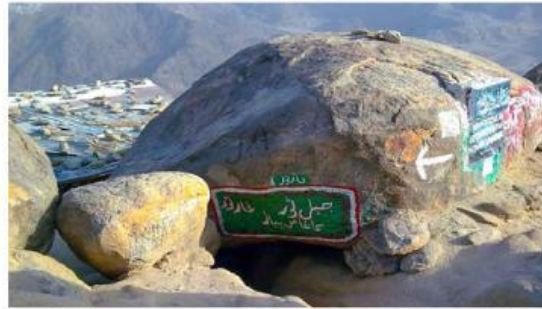
B. Bersembunyi di gua Tsur