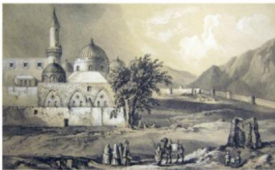
C. Tiba di Madinah