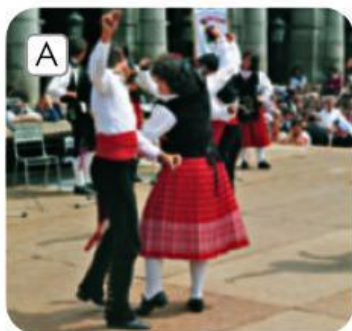
Fiesta de Carnaval

29 Identifica qué testimonio del pasado representa cada fotografía.