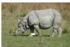
Bdak bercula satu