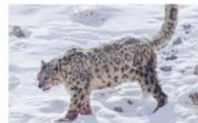
Macan Tutul Salju

Kelompokkan flora/fauna yang kamu temukan dari gambar di atas ke dalam tingkat keanekaragaman gen, spesies, dan ekosistem!