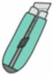
คัตเตอร์