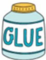
กาวลาเท็กซ์