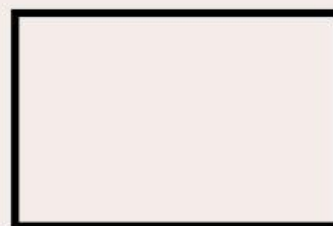
sila ke 2