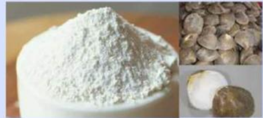
Kapur Sirih Cangkang Lokan

Di Provinsi Riau, masyarakat Melayu memiliki tradisi Balimau yang dilakukan menjelang Ramadhan, yaitu mandi dengan campuran air perasan jeruk limau, serta berbagai rempah-rempah lainnya. Masyarakat meyakini bahwa jeruk limau memberikan manfaat menyegarkan dan membersihkan kulit. Hal ini berkaitan dengan kandungan senyawa asam sitrat ( C_6H_8O_7 ) yang bersifat antibakteri ringan, serta asam askorbat (vitamin C) yang berperan sebagai antioksidan alami. Namun, penggunaan air jeruk limau dalam jumlah berlebihan tanpa takaran yang tepat dapat menyebabkan campuran air Balimau menjadi terlalu asam, sehingga berisiko mengganggu pH alami kulit, terutama bagi kulit sensitif. Hal ini menunjukkan bahwa meskipun tradisi ini memiliki nilai budaya dan manfaat kimiawi, pemahaman ilmiah tetap diperlukan untuk memastikan keamanan masyarakat.